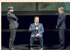
De Verleiders, door de bank genomen, het theaterspektakel over de wereld van het grote geld, verleiding en fraude is nog tot 27 juli 2016 te zien in Nederlanders theaters.